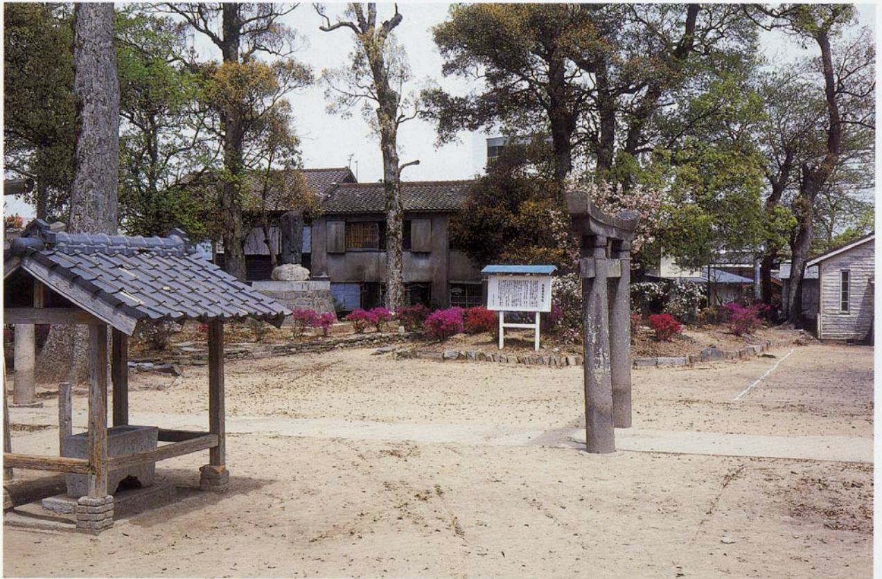
筑後国分寺跡の所在する国分町日吉神社境内