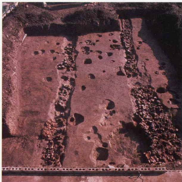
北面築地跡の雨落溝遺構