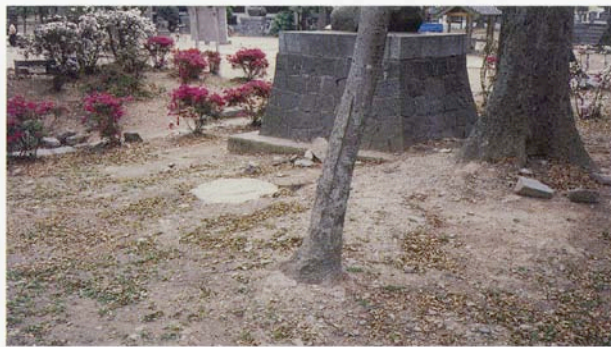
日吉神社に残る講堂跡の礎石

筑後国分僧寺は、確認された講堂と塔ならびに築地を手がかりに推定する。講堂の前面に塔を検出するが、講堂の主軸延長線より東に位置し、その距離は約85mを測る。金堂の所在については、発掘調査によるところはないが、古くは講堂の前面および塔の北西に「塚」の所在が伝えられ、これをもって金堂の基壇と推定したい。講堂・金堂さらに金堂の南東前面には塔が想定される。その他の建物については、東大寺の建物配置に比較すると、推定主軸線上に講堂・金堂・中門・南大門が並び、金堂より中門まで塔を囲んで回廊が設置されたと推定できる。これらの主要な建物の外側を築地が囲んでいる第 図に示すような配置が考えられる。筑前国分寺と同様な配置を示し、同一設計図によるものであろう。